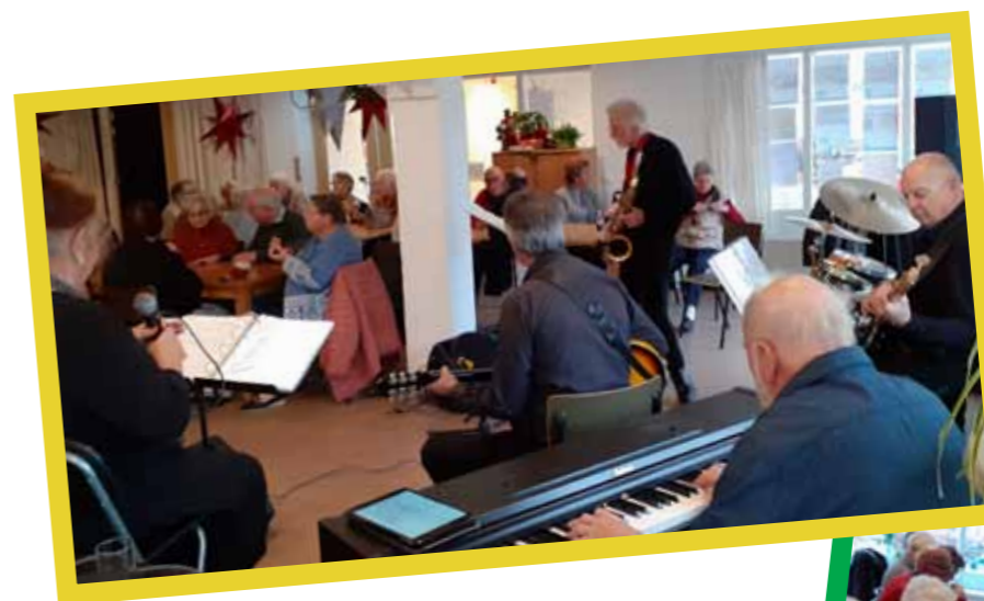
Swingo verslag op blz. 17

Geanonimiseerde adresgegevens worden verstrekt door de gemeente. Als u niet wilt dat uw adres wordt verstrekt, kunt u contact opnemen met de gemeente.