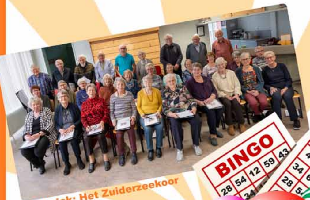
Muziek: Het Zuiderzeekoor